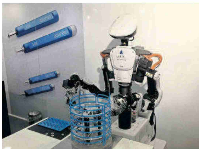
Humanoid Power, sauveur de la sous-traitance? J-M CORSET