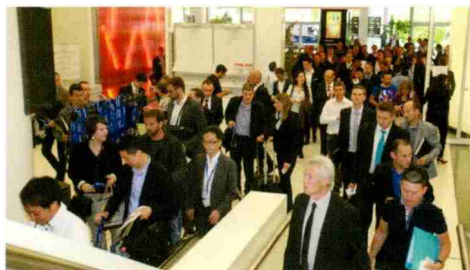
L'arrivée des visiteurs du Salon EPHJ-EPMT-SMT.

Réunissant leurs forces et capacités d'invention, les entreprises exposantes ont conclu l'édition 2015 du salon sous le signe de la réussite. ☉ ☉