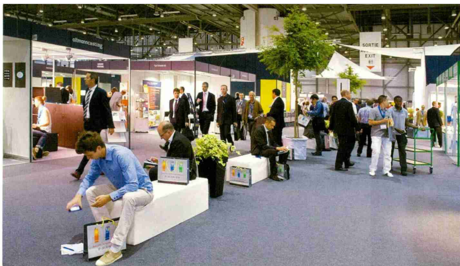
Une grande densité de visiteurs.

Manifestation emblématique des domaines techniques de la haute précision et des microtechniques, EPHJ-EPMT-SMT célébrera son 15 ème anniversaire à Palexpo Genève, du 14 au 17 juin. Voici en avant-première, un aperçu de ce triple salon avant la présentation qui paraîtra dans le numéro de mai de La Revue Polytechnique.