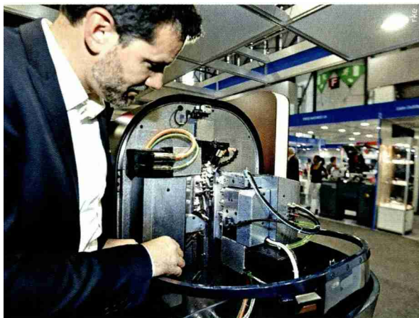
Un exposant fidèle parmi d'autres : Tornos-Almac.