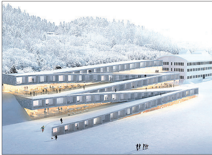
BRASSUS (VD). Construit par Audemars Piguet, l'édifice en forme de «Z» accueillera 50 chambres au début de 2020.